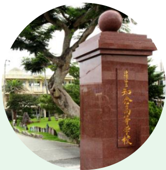
「進学重点拠点校事業」 推進校の知念高等学校